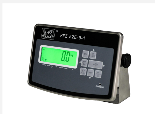
Standardowy miernik wagowy